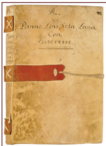
ASBN, Monte di credito su pegno di Cusano Mutri , n. 113 - Libro dei pegni di panno, lino, seta e lana con interesse - 1797.

Nati nella seconda metà del XV secolo per combattere la miseria e l'usura, i monti di pietà si diffondono rapidamente nonostante l'acceso dibattito all'interno della Chiesa sulla liceità di chiedere un interesse sia pur minimo sui prestiti. La questione è discussa nel concilio lateranense del 1515 e risolta a favore della liceità con la bolla "Inter multiplices" che Leone X emana nello stesso anno.